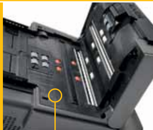
Calidad de construcción sólida

PROCESOS SIMPLIFICADOS COMUNICACIÓN MEJORADA PRODUCTIVIDAD MEJORADA