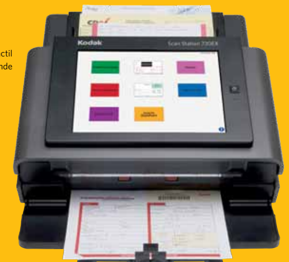
Pantalla táctil grande

Solo Kodak Alaris ofrece servicios esenciales para garantizar el funcionamiento óptimo de la solución de escaneo durante la instalación y después. Los servicios del Scan Station 730EX de Kodak , como Startup Assistance y Network Scanner Training, ponen el conocimiento de Kodak Alaris a su disposición. Además, el acceso a nuestra asistencia al usuario y los expertos en el producto junto con las últimas mejoras del producto permiten que el Scan Station 730EX Kodak satisfaga durante los próximos años las necesidades de procesos comerciales en constante evolución.