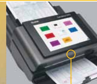
Manejo del papel mejorado